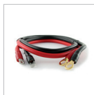
Cavo di ingresso 22mm 2 occhielli Ø6mm / Ø10mm