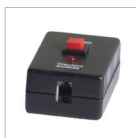
KIPR5 Telecomando controllo remoto on/off 5m